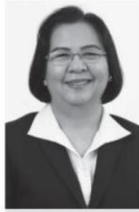
ทัศนีย์ เมืองแก้ว

สำนักงานเศรษฐกิจการเกษตร (สศก.) เปิดเผยว่า ในปีงบประมาณ 2562 สศก. ร่วมกับสภาผู้ส่งสินค้าทางเรือแห่งประเทศไทย (สรท.) ศึกษารูปแบบการพัฒนาระบบการบริหารจัดการโซ่ความเย็น (Cold Chain) ในสินค้าพืชผักและผลไม้ (อาทิ เงาะ ทุเรียน มังคุด ขนุน กะเพรา แตงกวา หมอไม้ฝรั่ง และ เห็ด) ของสถาบันเกษตรกรในพื้นที่เขตพัฒนาพิเศษภาคตะวันออก (Eastern Economic Corridor: EEC) และพื้นที่ใกล้เคียง