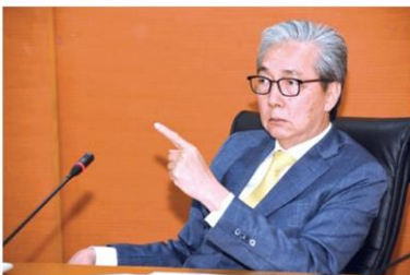
'สมคิด' รุกสินค้าเกษตรแปรรูป จี 'อุต-ธกส.' เพิ่มมูลค่าผลผลิต